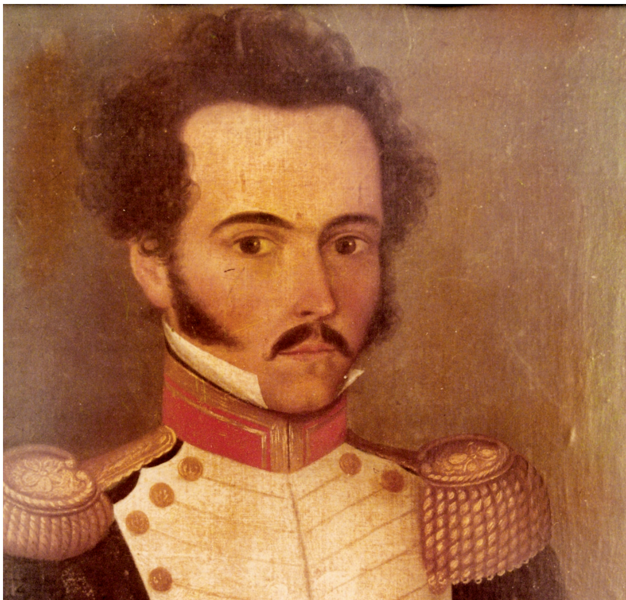
Anónimo, Bogotá, 1812. Colección Quinta Bolívar de Bogotá.

La PRIMERA FASE de la revolución venezolana de Independencia termina en un rotundo fracaso. El desastre de los patriotas es total. Debilitada por la puesta en práctica de políticas equivocadas, consumida por sus contradicciones internas, por rivalidades y pequeñeces de todo tipo, carente de apoyo popular, e incapaz de obtener victorias militares y de enfrentar la brutal ofensiva de los españoles, la llamada Primera República o República Boba se desmorona; y su líder, Francisco de Miranda, el gran héroe venezolano de la Revolución Francesa, se ve forzado a capitular a mediados de 1812 ante Domingo Monteverde, jefe de la reacción realista, apenas a un año de haber sido proclamada la Independencia.