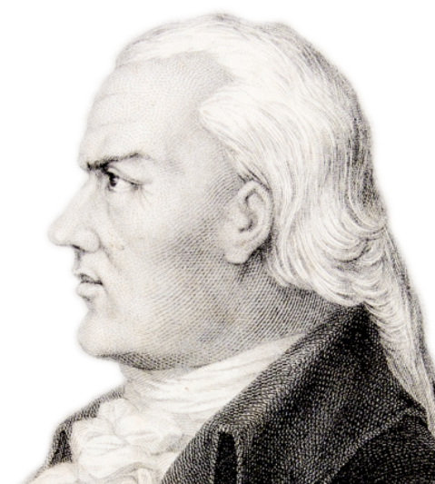
Francisco de Miranda.

11 Se quiere hacer mención a la rebelión de la ciudad de Valencia, seis días luego del 5 de julio de 1811. Inmediatamente, el Marqués del Toro marchó hacia el lugar y encontró fuerte resistencia en Mariara, pero su ineficiencia hizo que fuera sustituido por Francisco de Miranda, quien entró en la ciudad el 23 de julio y luego de un fuerte sitio, la ciudad capitula el 13 de agosto de 1811.