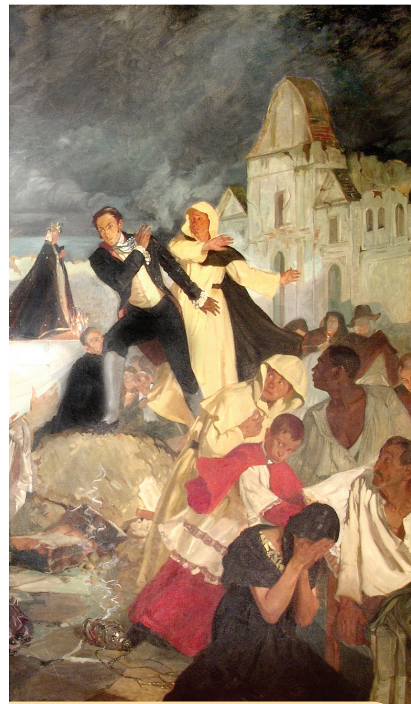
Tito Salas. Terremoto de Caracas 26 de marzo 1812, 1929. Colección Casa Natal del Libertador.

Coro ciertamente no habría podido nunca entrar en competencia con Caracas, si la comparamos, en sus fuerzas intrínsecas, con ésta; mas como en el orden de las vicisitudes humanas no es siempre la mayoría de la masa física la que decide, sino que es la superioridad de la fuerza moral la que inclina hacia sí la balanza política, no debió el Gobierno de Venezuela, por esta razón, haber descuidado la extirpación de un enemigo, que aunque aparentemente débil tenía por auxiliares a la Provincia de Maracaibo; a todas las que obedecen a la Regencia; el oro y la cooperación de nuestros eternos contrarios los europeos que viven con nosotros; el partido clerical, siempre adicto a su apoyo y compañero el despotismo; y sobre todo, la opinión inveterada de cuantos ignorantes y supersticiosos contienen los límites