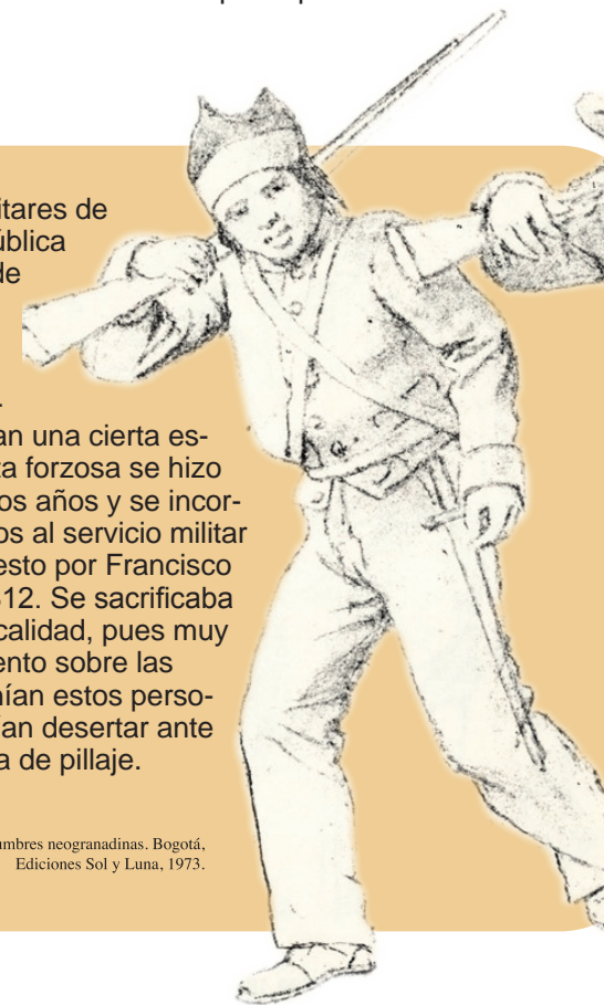
Ramón Torres Méndez. Costumbres neogranadinas. Bogotá, Ediciones Sol y Luna, 1973.

6 Para septiembre de 1811 se contemplaba con fuerza en el seno del Congreso la posibilidad de dividir en dos la Provincia de Caracas, lo cual iba a conferir mayor importancia a ciudades como Coro y Maracaibo. Sin embargo, el 15 de octubre de ese año se concluyó que las provincias se iban a confederar sin que Caracas se dividiera, a menos que así lo requiriese el órgano. Esto trajo fuertes oposiciones entre las regiones occidentales, así como la ratificación de la sultana del Ávila como capital de la República.