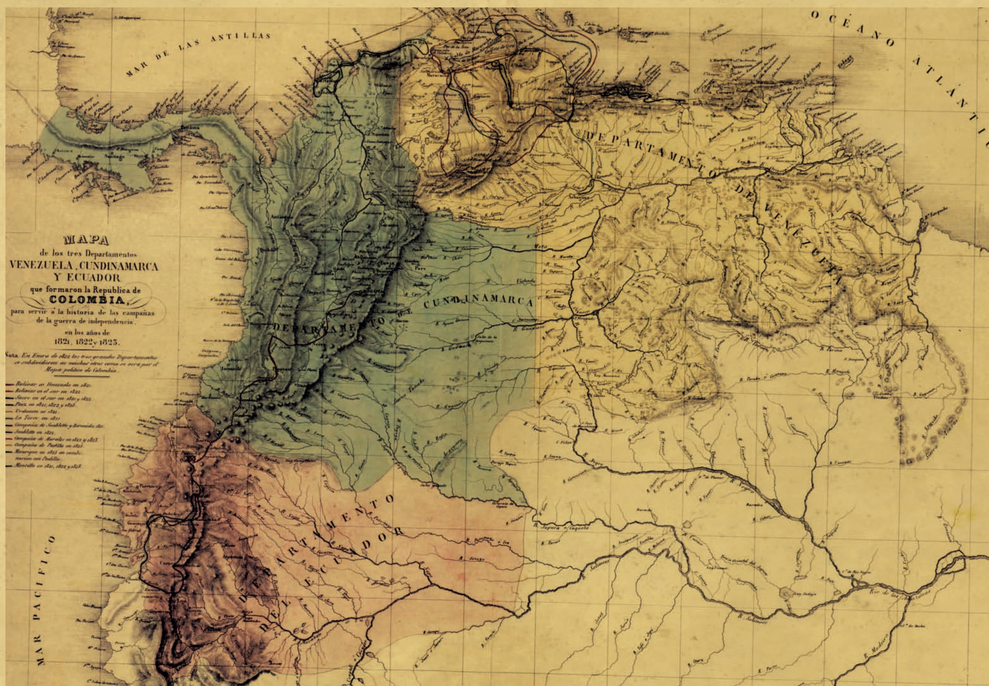
“Mapa de los tres Departamentos Venezuela, Cundinamarca y Ecuador que formaron la República de Colombia”, en Agustín Codazzi. Atlas Físico y Político de la República de Venezuela. París, 1840.