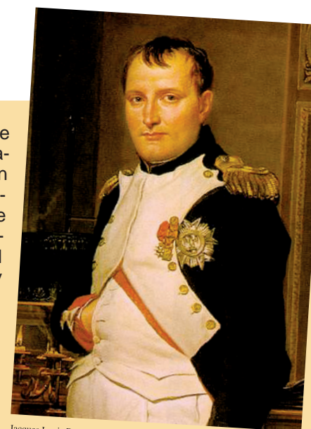
Jacques Louis David, El emperador Napoleón en su estudio de las Tullerías. Galería Nacional de Washington. 1812

13 Militar y gobernante que jugó un papel fundamental en la Revolución Francesa. Lideró el golpe de Estado del 18 de Brumario que lo transformaría en Primer Cónsul de la República (1799) y Cónsul vitalicio (1802). Es proclamado Emperador de los Franceses, y se coronó el 2 de diciembre de 1804. En su afán expansionista se hizo nombrar Rey de Italia en marzo de 1805. Tuvo tal poder que mantuvo la conducción de casi toda Europa Occidental y Central durante una década. En 1808 invadió España, a la que sometió hasta que fue derrotado en la Batalla de las Naciones en 1813.